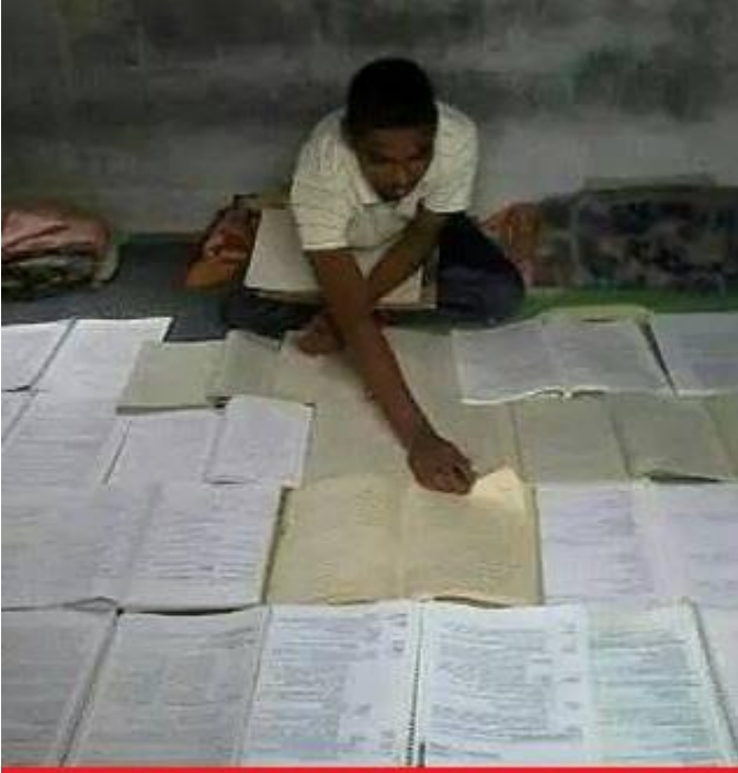
SINAV AKŞAMI BEN