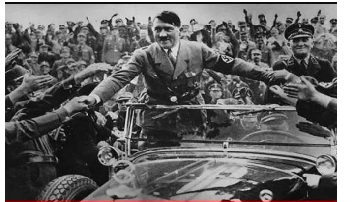
Arkadaşlarıma kopya verdiğim sınavın çıkışında