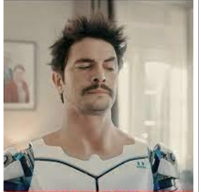
YANIMDAKİ SIRADAN KOPYA ÇEKERKEN