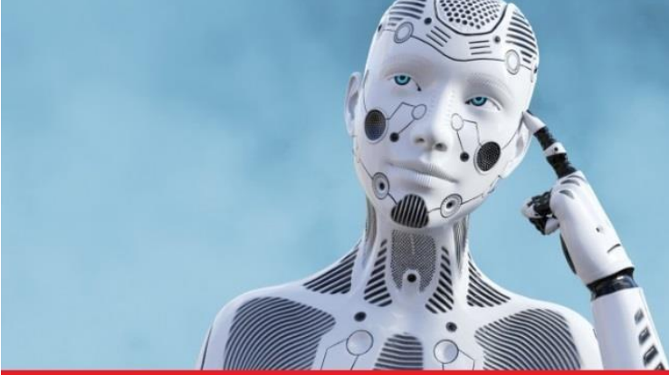
KOPYA ÇEKMEYE ÇALIŞIRKEN HOCA GÖRÜNCE