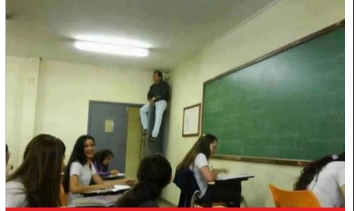
SINAVLARDA ÖĞRETMENLER (T)