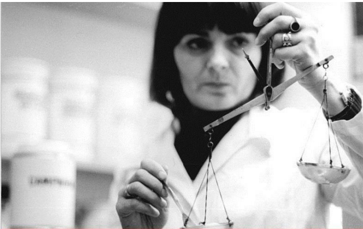
SINAV KAĞIDINI OKURKEN ÖĞRETMENLER