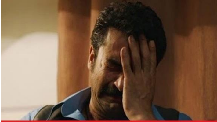
DENEMEDE İLK 3'E GİREMEMİŞİM