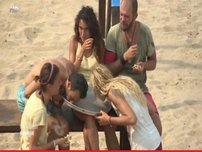
OKULDA ARKADAŞLARLA ORTAK BİR ŞEY ALINCA YEME ŞEKLİMİZ