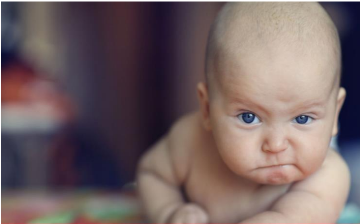
BAYRAMDA 5 LİRA VEREN AKRABAYA TEPKİM