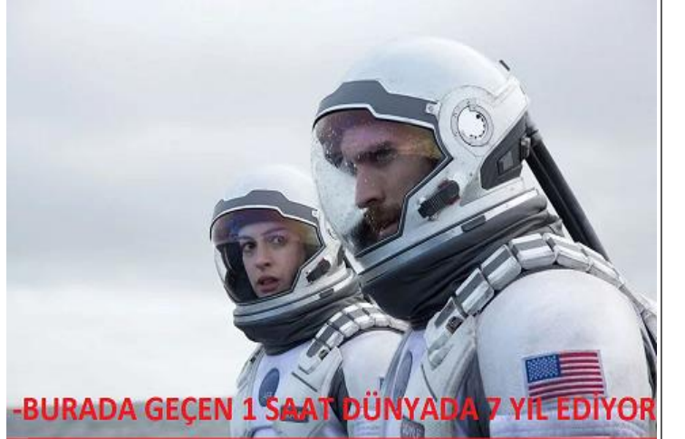
BURADA GEÇEN 1 SAAT DÜNYADA 7 YIL EDİYOR