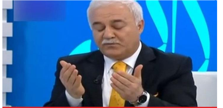
SINAVLARDAN ÖNCE BEN